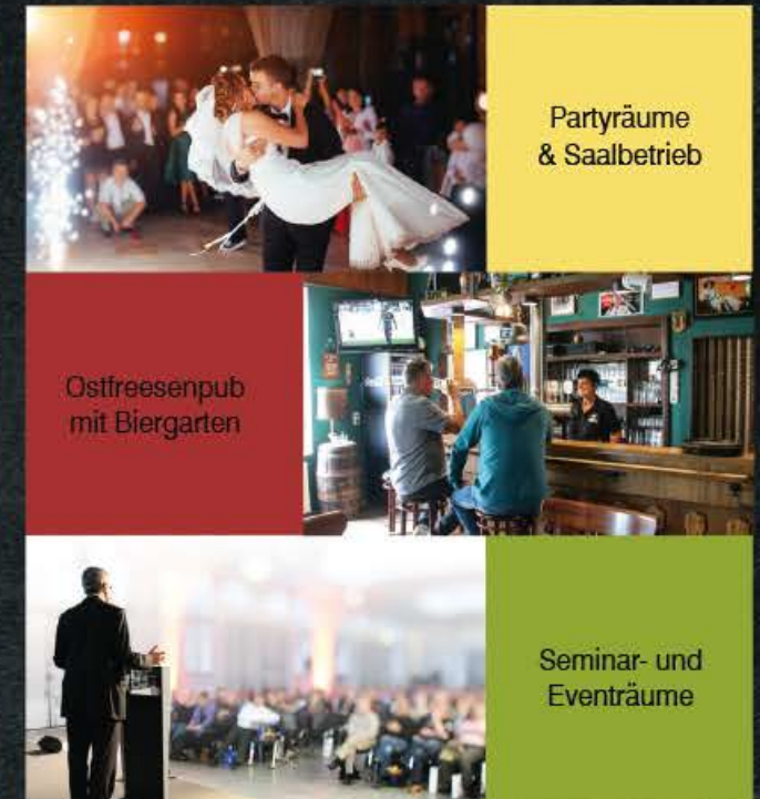
Partyräume & Saalbetrieb