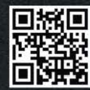
Seminar- und Eventräume

Stammtisch, Festsaal oder Seminarraum buchen? Scan it!